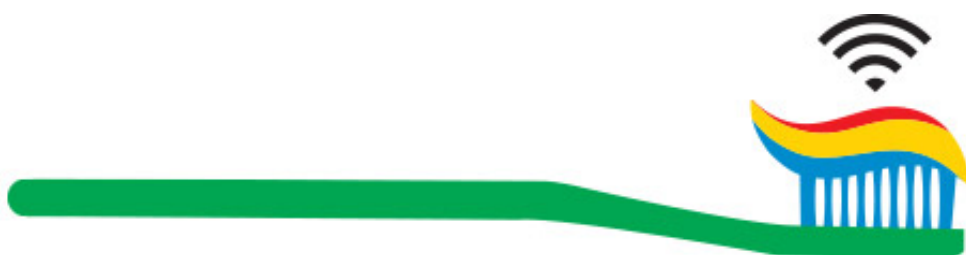
Illustration de Séverin Millet pour Téléràma

Le premier contact est intimidant. Je dois saisir le volant et conduire moi-même la voiture jusqu'à destination afin qu'elle mémorise le trajet. Direction le lycée. Depuis que le Nevada a délivré sa première immatriculation à un véhicule autonome, en 2012 , les plaques rouges frappées du huit renversé de l'infini se sont multipliées, aux Etats-Unis comme ailleurs.